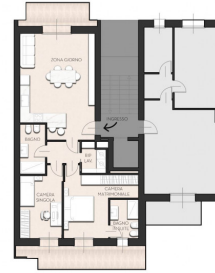
PIANO TIPO - TRILOCALE La descrizione è indicativa e non costituisce elemento di misura e di controllo. La planimetria è a solo scopo illustrativo.