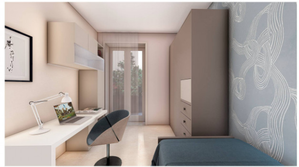
PIANO TIPO - TRILOCALE - Camera singola La descrizione è indicativa e non costituisce elemento di misura e di controllo. Il render è a solo scopo illustrativo.