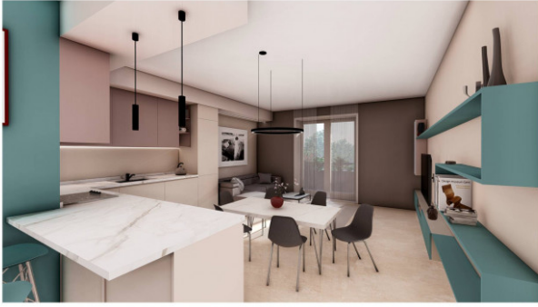
PIANO TIPO - TRILOCALE - Zona giorno La descrizione è indicativa e non costituisce elemento di misura e di controllo. Il render è a solo scopo illustrativo.