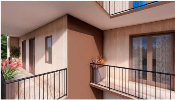
PIANO TIPO - TRILOCALE - Balcone La descrizione è indicativa e non costituisce elemento di misura e di controllo. Il render è a solo scopo illustrativo.