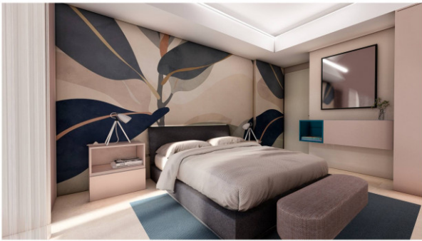
PIANO TIPO - TRILOCALE - Camera matrimoniale La descrizione è indicativa e non costituisce elemento di misura e di controllo. Il render è a solo scopo illustrativo.