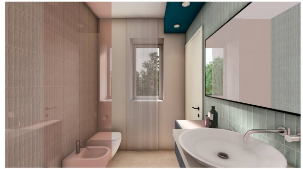
PIANO TIPO - TRILOCALE - Bagno La descrizione è indicativa e non costituisce elemento di misura e di controllo. Il render è a solo scopo illustrativo.